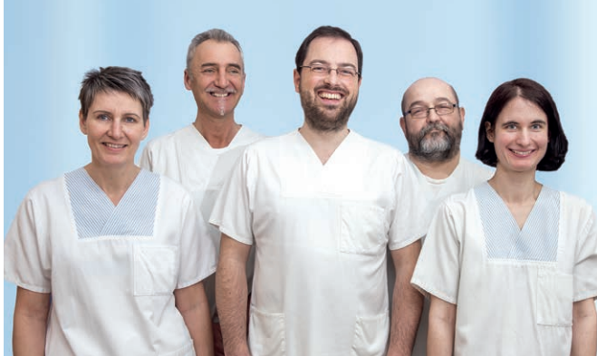
Das Team der Physikalischen Therapie am Krankenhaus St. Barbara